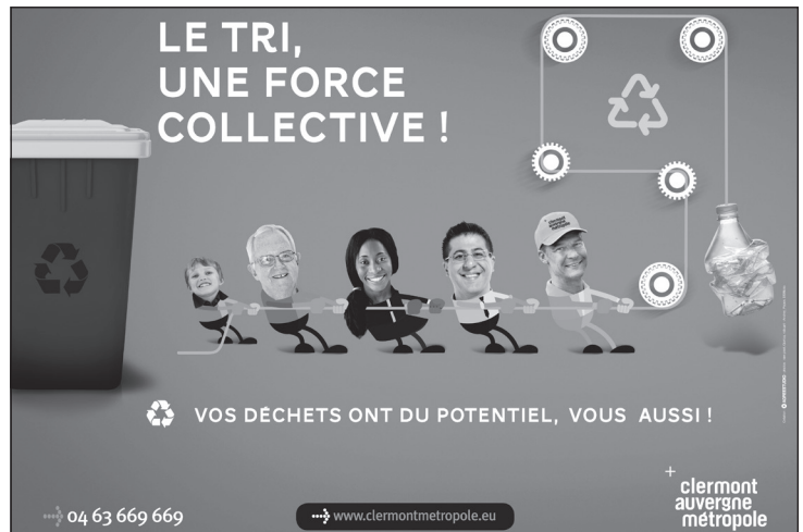
Doc. 2 Affiche pour le tri sélectif à Clermont-Ferrand.

1. Colorie dans le document 1 : en vert les déchets recyclés, en jaune les déchets biodégradables, en rouge les déchets non recyclés.