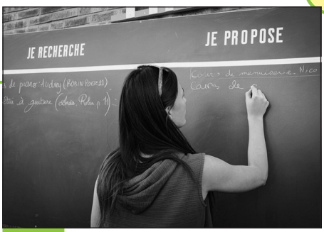
Doc. 5 Aux Grands voisins, l'entraide et le troc font partie du quotidien.