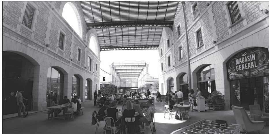
Doc. 2 Le restaurant du projet Darwin.

À Darwin, tout le monde peut venir manger au restaurant, acheter des produits biologiques, faire réparer ou acheter un vélo, pratiquer le skate ou louer un bureau pour installer sa petite entreprise.