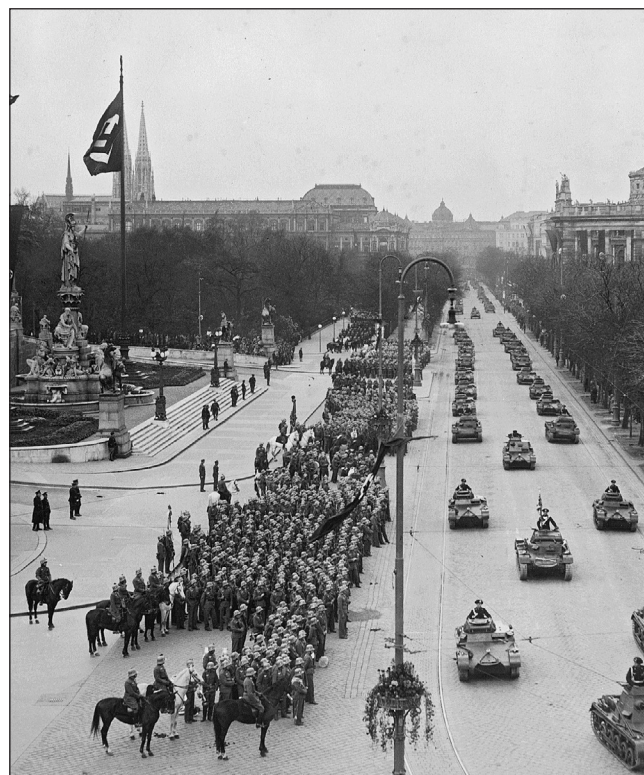
Doc. 3 En mars 1938, Hitler rentre dans Vienne et annexe l'Autriche.