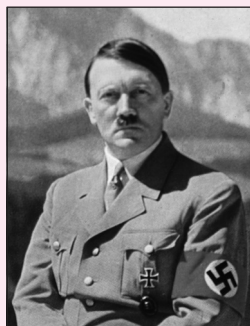
Extrait de J. Portes, Initiation à l'histoire du monde au XX e siècle , Ellipses, 1999.

Hitler est persuadé depuis longtemps de la faiblesse des pays démocratiques. Son but est d'annuler certaines des clauses humiliantes du traité de Versailles, puis de mettre en pratique sa recherche d'espace pour une Allemagne surpeuplée, aux dépens des peuples inférieurs que sont les Slaves et de l'ennemi traditionnel, les Français.