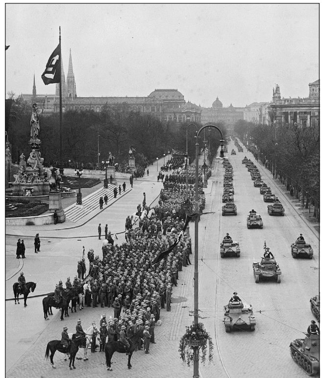
Doc. 3 En mars 1938, Hitler rentre dans Vienne et annexe l'Autriche.