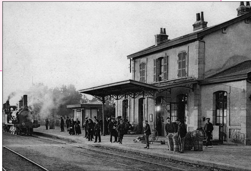
Gare de Saint-Pol-de-Léon, XIX e siècle.

Un adieu signifie qu'on ne se reverra qu'au "ciel", donc elle pense ne jamais revenir.