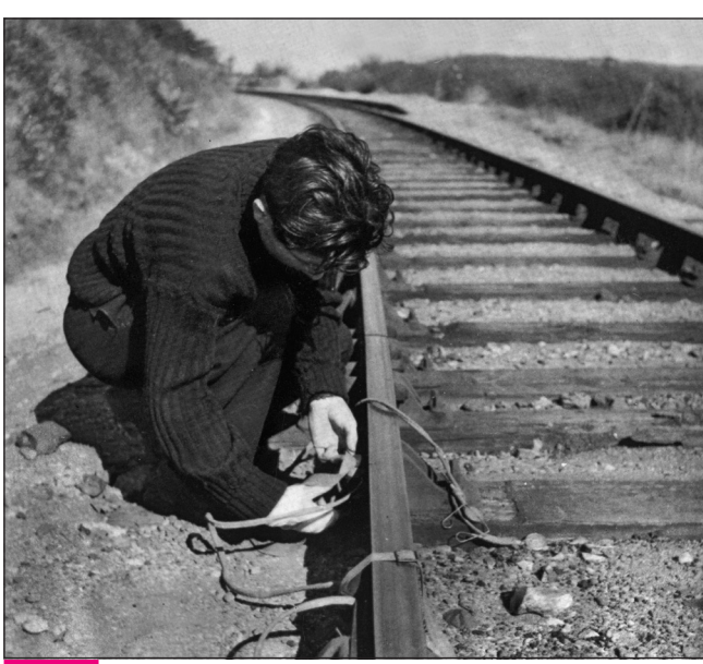
Doc. 4 Opération de sabotage menée par un résistant en 1942.

5. Ces Français sont-ils (doc. 3) : des collaborateurs ? des résistants ?