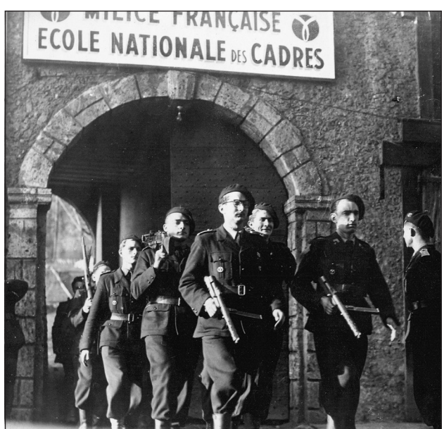
Doc. 3 Miliciens à Uriage, dans le département de l'Isère, 1941. Certains Français ont décidé de s'engager dans la milice française, organisation armée fondée par le régime de Pétain, pour traquer les résistants et les Juifs.