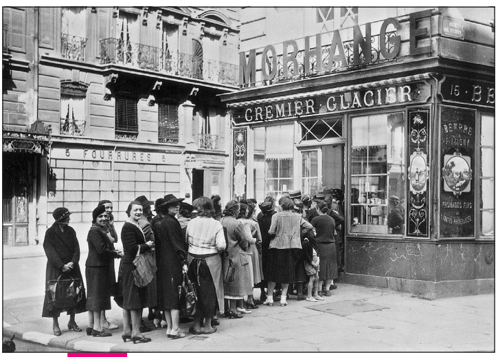
Doc. 5 Queue devant un magasin d'alimentation à Paris pendant l'occupation. La nourriture est rationnée dès les débuts de l'occupation, et les Français sont très préoccupés par leur survie.

8. À ton avis, pourquoi l'alimentation est-elle rationnée durant l'occupation ? À qui sont destinés les produits alimentaires en priorité ?