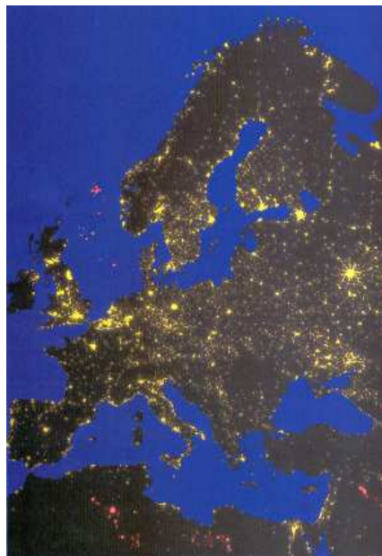
L'Europe, vue d'un satellite, la nuit...