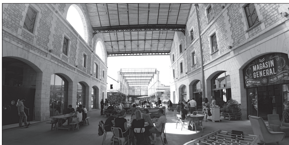
Doc. 2 Le restaurant du projet Darwin.

À Darwin, tout le monde peut venir manger au restaurant, acheter des produits biologiques, faire réparer ou acheter un vélo, pratiquer le skate ou louer un bureau pour installer sa petite entreprise.