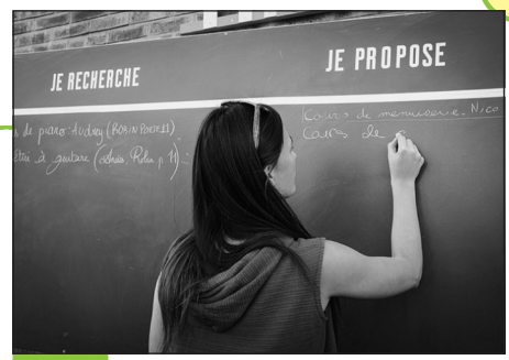
Doc. 5 Aux Grands voisins, l'entraide et le troc font partie du quotidien.