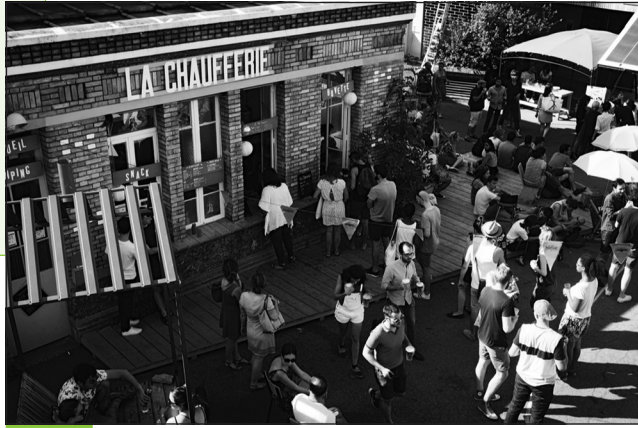
Doc. 6 La chaufferie est un espace convivial d'échanges.