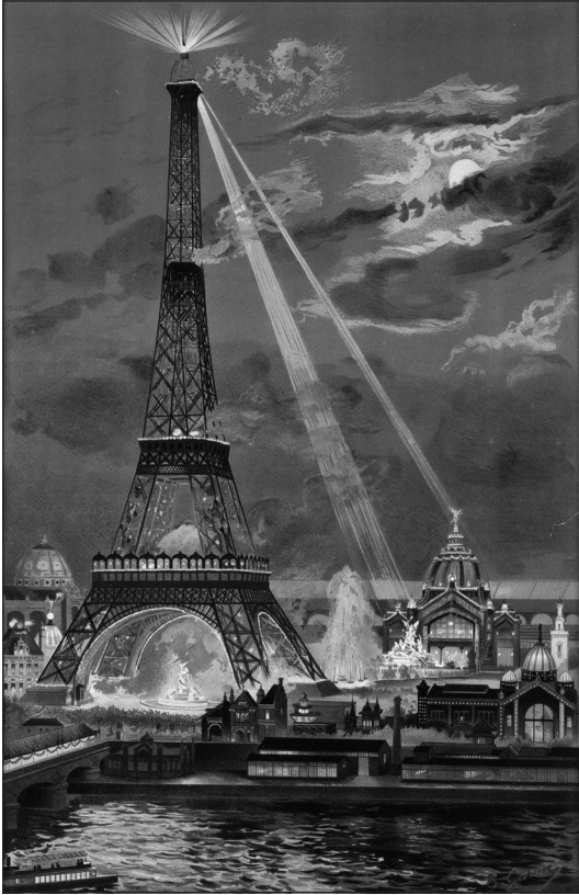
Doc. 1 La tour Eiffel lors de l'Exposition universelle de 1889. Estampe, 1889.