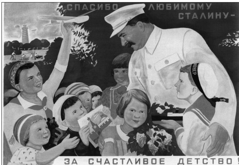
Doc. 4 Affiche officielle, Staline « petit père des peuples », années 1930. « Grâce à notre bien-aimé Staline, nos enfants grandissent dans la joie et la prospérité. »

6. Comment sont représentés Hitler et Staline sur ces deux affiches ?