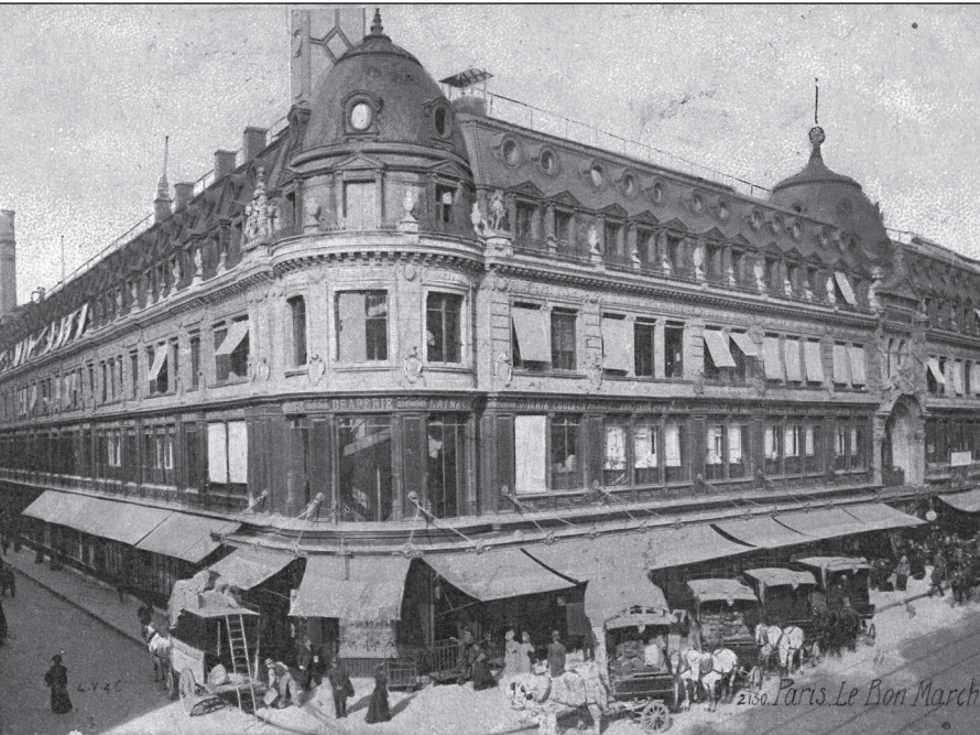
Doc. 1 Le Bon Marché en 1869.

J'observe le développement et le succès d'un grand magasin à Paris.