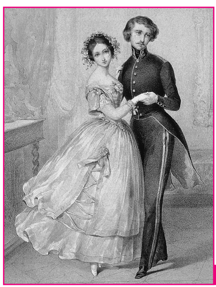
Doc. 4 Un couple dansant la valse au XIXe siècle.

9. Pourquoi peut-on dire que les femmes s'émancipent dans les années 1920 ? Regarde les documents 3 et 4 et compare en répondant par oui ou par non :