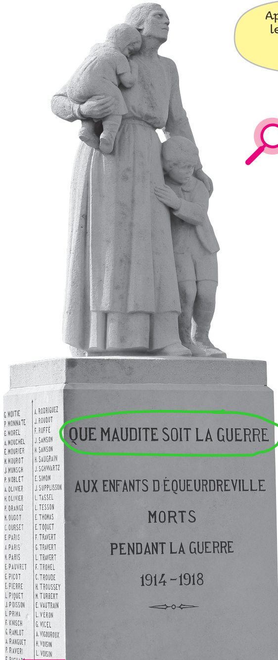
Doc. 1 Monument aux morts de la commune d'Équeurdreville dans la Manche.