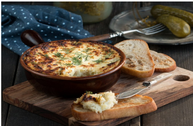
brandade de bacalhau