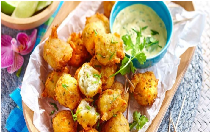
bolinhos de bacalhau