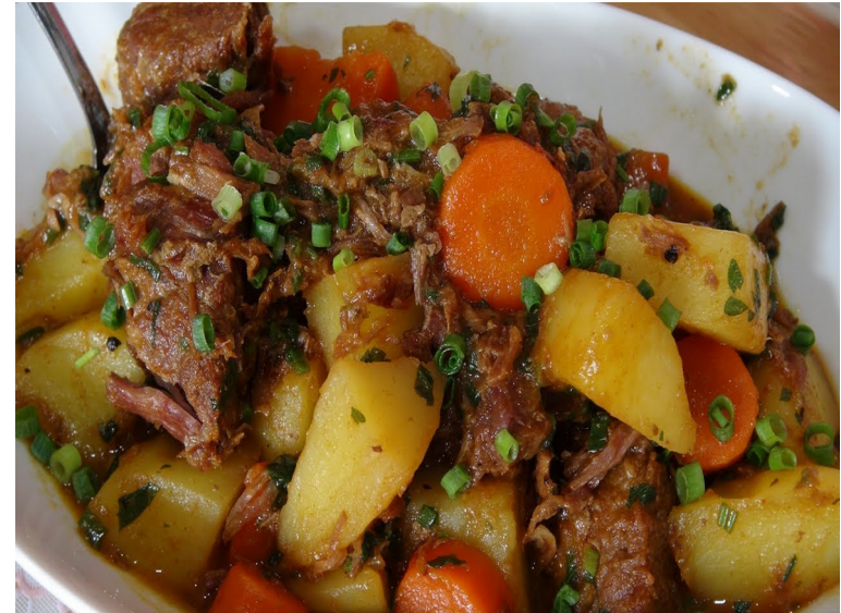
carne e batatas