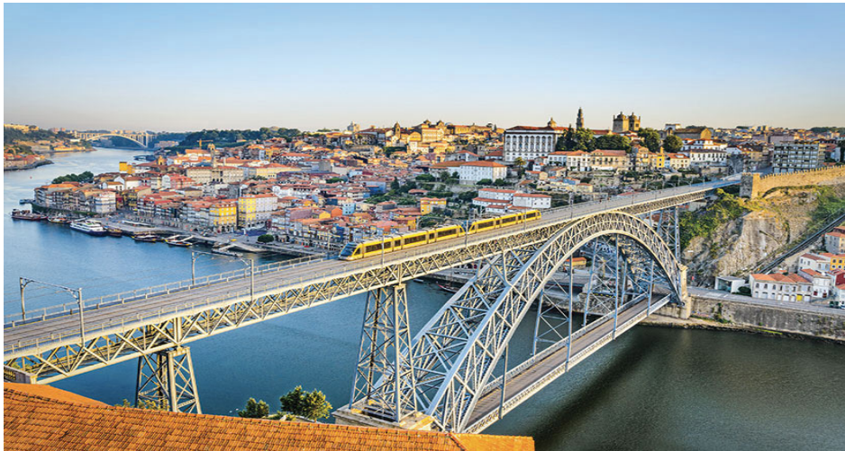
pont du tejo