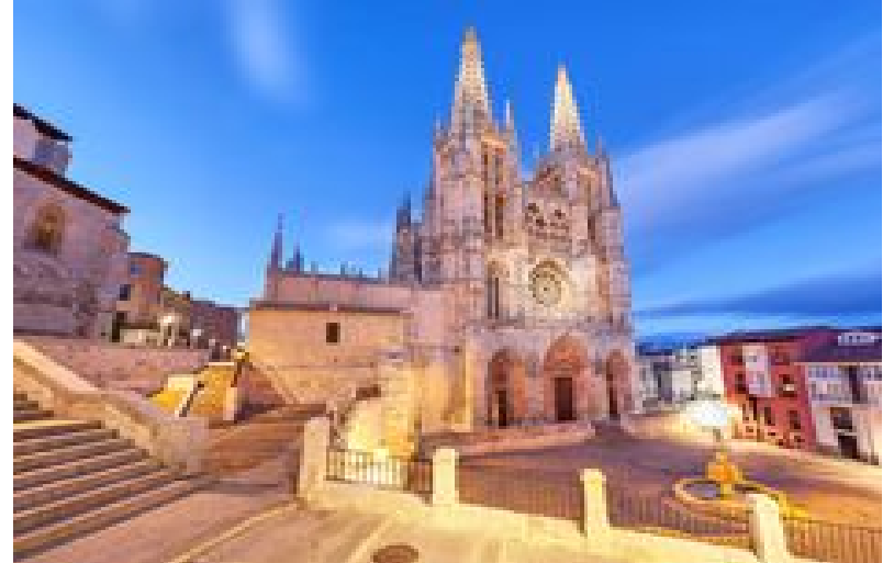
cathédrale santa maria maior de lisbonne