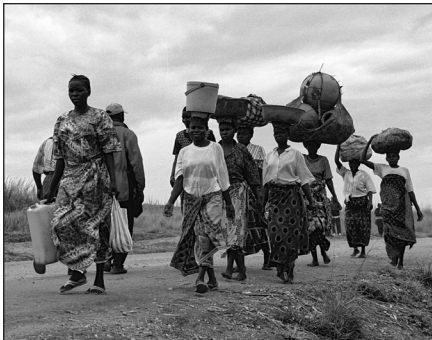
marche à pieds